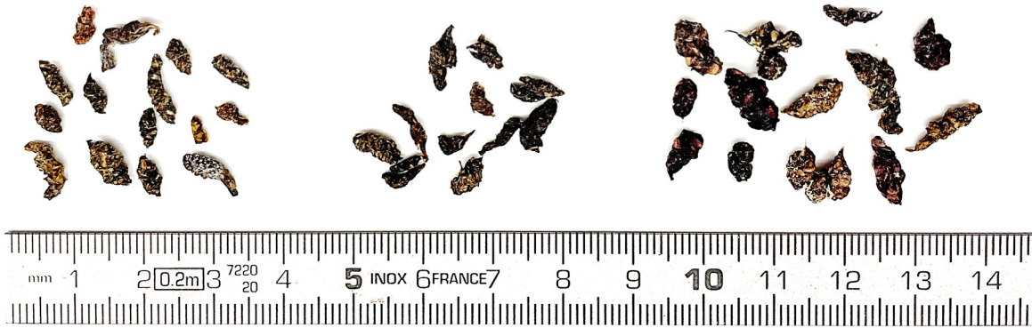
Abbildung 2: Kot vom Siebenschläfer ( Glis glis ) in verschiedenen Grössen und Ausführungen.

Oft zeigen Sieben- und Gartenschläfer vor dem Menschen wenig Scheu und könnten beinahe von Hand gefangen werden. Im Hinblick auf allfällige Bisse sollte man dies jedoch unterlassen. Alle Tiere sind aber nicht so zutraulich. Dann verraten oft Spuren ihre Anwesenheit: die Schlafmäuse gehören zu den Nagetieren, haben also im Ober- und Unterkiefer je zwei scharfe Schneidezähne, die charakteristische Nagespuren an Nahrung und Einrichtungen hinterlassen. Sieben und Gartenschläfer sind auch sehr stimmfreudig: sie quieken, pfeifen, zwitschern und murmeln. Der Kot ist bohnenförmig oder gleicht einem Reiskorn, ist 0.5 bis 2 cm lang sowie geruchlos (Abbildung 2).