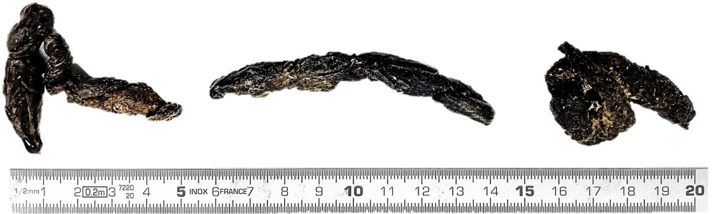
Abbildung 5: Kot vom Steinmarder ( Martes foina ) in verschiedenen Grössen und Ausführungen.