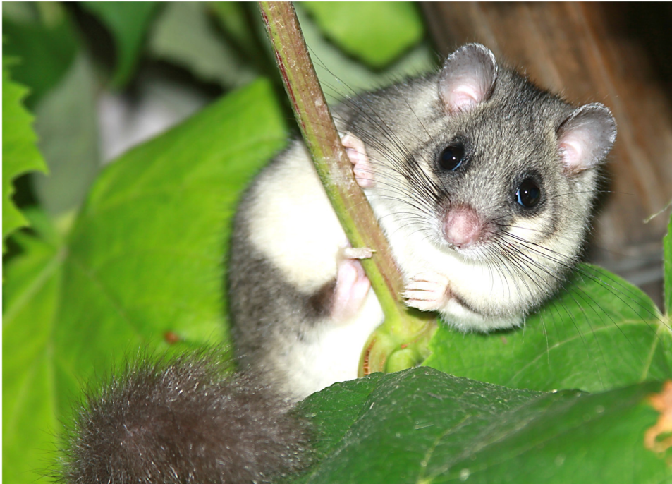
Abbildung 1: Von September bis maximal Mai verbringen Siebenschläfer ihren Winterschlaf und verursachen in diesem Zeitraum keinen Lärm.

Bei der Suche nach einem Dach über dem Kopf werden Sieben- (Abbildung 1) und Gartenschläfer, die normalerweise im Wald leben, oft in unseren Gebäuden fündig. Ein geschütztes, warmes Plätzchen zum Errichten eines Nestes findet sich in vielen Scheunen, Ställen, Alphütten, Ferien-, Schützen- und sogar in Bienenhäusern. Aber auch ständig bewohnte Gebäude weisen im Keller oder unter dem Dach oft ein kleines Loch oder eine schmale Ritze auf, die für die kleinen Kobolde gross genug ist, sich durchzuzwängen. Leider lassen sich die Interessen der heimlichen Untermieter nicht immer mit denjenigen der Hausbewohner und -besitzer vereinbaren.