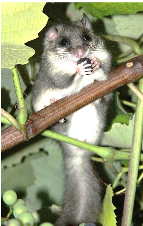
Abbildung 3: Für das Beködern einer Falle eignen sich reife Früchte jeglicher Art, Nüsse, Trocken- und Hackfleisch oder Erdnussbutter. Bei Früchten sollten jeweils solche gewählt werden, die in der Natur aktuell gerade nicht reif sind oder in der Umgebung nicht vorkommen. Auch reife Trauben, Nektarinen, Pfirsiche oder Aprikosen eignen sich sehr gut.