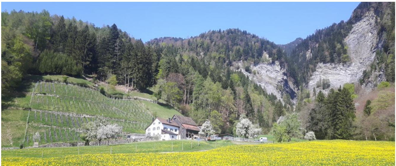
Möglicher Lebensraum für Zwergohreule in Jenins

Die Zwergohreule ist eine wärmeliebende Art, die von Grossinsekten lebt und in Baumhöhlen brütet. Daher ist die Zwergohreule an strukturreichen, sonnigen Hängen, in Baumbeständen, die an insektenreiche Wiesen (idealerweise Magerweiden) grenzen zu erwarten.