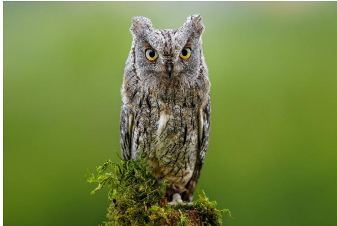
Zwergohreule, Bild aus dem Internet