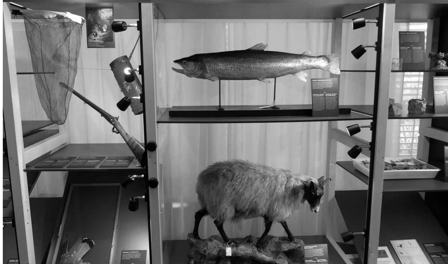
150 Objekte – jedes mit seiner Geschichte.