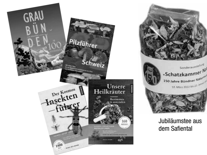
Jubiläumstee aus dem Safiental

Wir feiern unsere Jubiläumsausstellung und geniessen die Sommertage, welche schon bald von den goldenen Herbsttagen abgelöst werden.